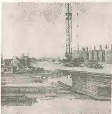
Construccion di Playa Linda Beach Resort ta avanzando. Cu finalisacion di e proyecto aki lo e yuda hopi den e desaroyo turistico cu Aruba ta conociendo.